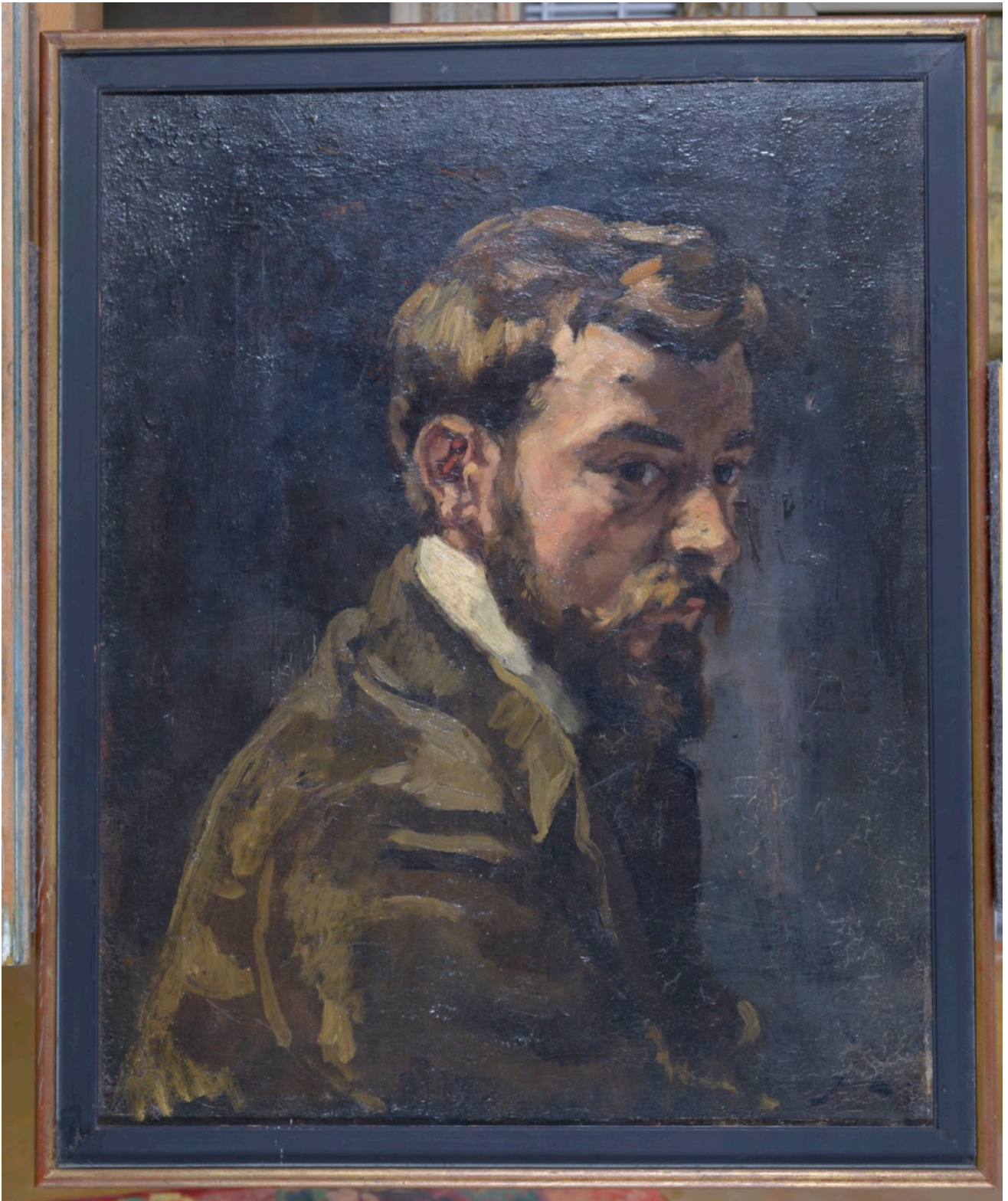
afb. 1 voorzijde schilderij met lijst voor conservering